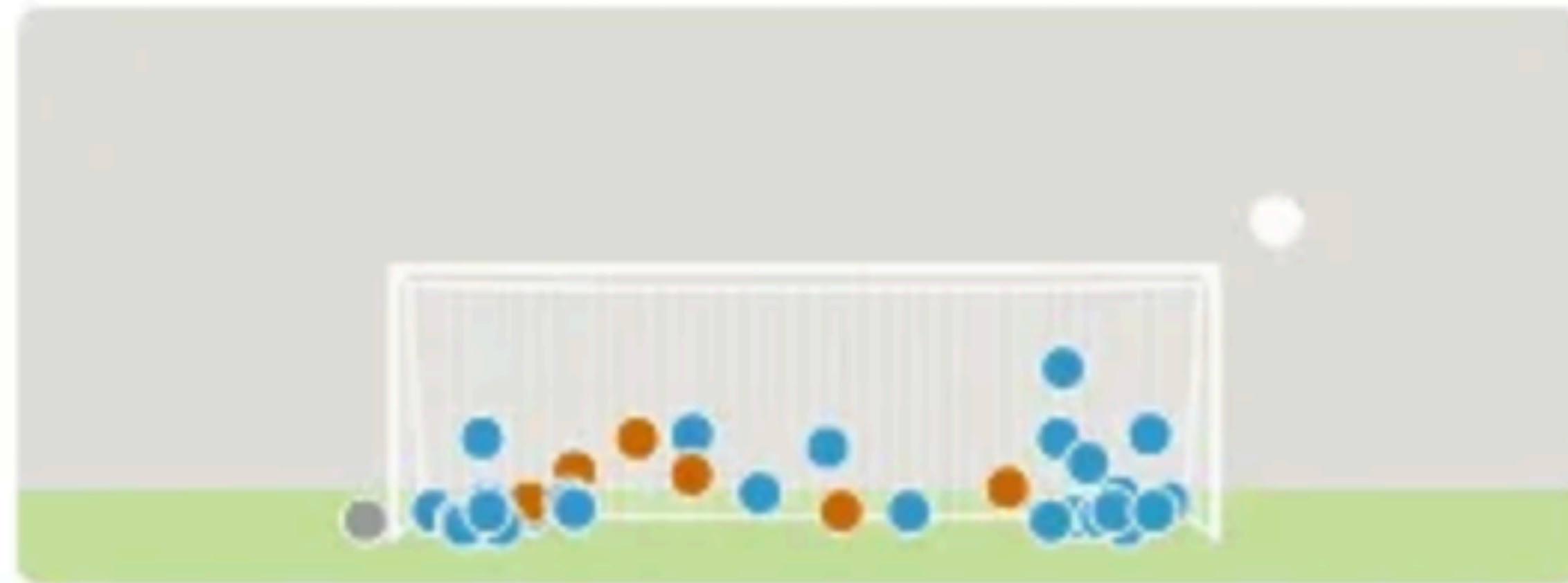
Edinson Cavani Uruguay